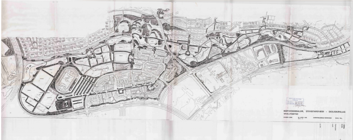
Mynd 1 Gildandi deiliskipulag Kópavogsdals, dagsett 1990.

Starfshópurinn hafði í starfi sínu hliðsjón af stefnu Kópavogsbæjar í tengdum málaflokkum svo sem Heimsmarkmiðum Sameinuðu þjóðanna, Barnasáttmálanum, Aðalskipulagi Kópavogs 2019-2040, Menningarstefnu, Lýðheilsustefnu og Jafnréttis- og mannréttindastefnu Kópavogs.