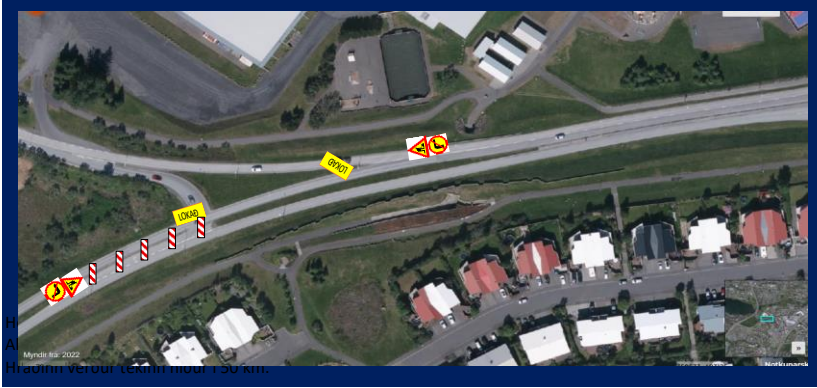
Mýndir frá 2022. Hraðinn verður tekinn niður í 50 km.