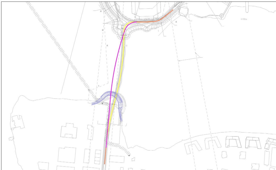
Lega Öldu í íhvolfum boga (gult) milli aðkomuvega (appelsínugult) í samanburði við ímyndaða kúpta veglínu (magenta). Grunnkort: Efla. Litaðar línur: VSÓ.

Brúin kemur inn á Kársnes eftir íhvolfum boga (e. concave). Til að tengja veglínu hennar rétt inn á Bakkabraut þarf að sveiga hana í kúptan boga (e. Convex). Hönnunarteymi brúarinnar (Efla og Vegagerðin ásamt ráðgjöfum) hefur upplýst bæjaryfirvöld um að fyrirliggjandi hönnun sé uppruninn úr vinningstillögu samkeppni brúarinnar. Sú hönnun liggur til grundvallar deiliskipulagsbreytingar sem unnið er að milli deiliskipulags brúar og Vesturvarar.