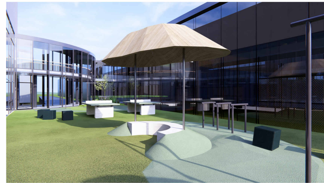
SKÝRINGARMYND: HORFT TIL VESTURS OG SÉÐ Í TENGIGANG