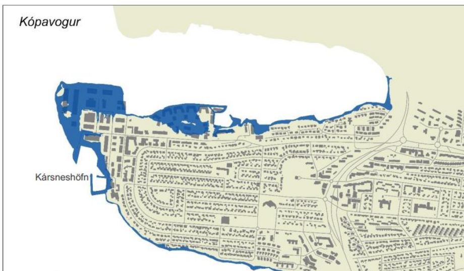
Mynd 3 Möguleg sjávarflóðasvæði í Kópavogi miðað við 4 m flóð í hæðakerfi Reykjavíkur (VSÓ, 2016).

Setja þarf skilmála í deiliskipulag þar sem gert er ráð fyrir forsendum um hækkandi sjávarstöðu. Í minnisblaði siglingasviðs Vegagerðarinnar til Kópavogsbæjar um hæð á landfyllingum í Fossvogi er lagt til að lágmarks gólfkótar húsa á landfyllingum í Fossvogi séu um 0,3 m hærri en lágmarks hæð landfyllingar, eða 4,41 m í hæðakerfi Reykjavíkurborgar og 6,23 m í hæðakerfi Sjómælinga Íslands.