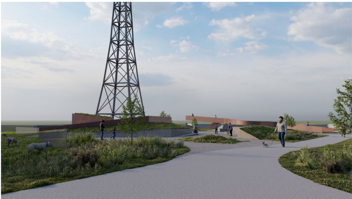
Fjarskiptamastur, útsýnis- og minningarreitur um fjarskiptasögu, fléttast saman við grænan geira og hundagerði á háholtinu.

Það er markmið deiliskipulags að mannvirki á háholtinu verði svæðinu til prýði og það eru settir skilmálar þar að lútandi varðandi gæði og efnisval fjarskiptamannvirkja. Notast skal við náttúruleg byggingarefni þannig að mannvirkið falli sem best að nærliggjandi umhverfi og lágmarka neikvæða ásýnd þess á umhverfið. Dæmi um efnisval t.d. Corten stál eða önnur dökk málmklæðning sem fellur vel að umhverfi sínu.