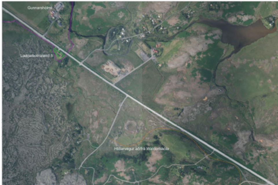
Mynd 1 Afstaða hlíðarvegur í Lækjarbotnum (appelsínugul lína) til landareignanna Gunnarshólma (ca. fjólubláa línan) og Lækjarbotnalands 5 (græna línan). Afmörkun fyrir Lækjarbotnaland 4 er ekki þekkt en skv. fasteignaskrá er lóðin 0 m 2 og stendur skammt sunnan við Lækjarbotnaland 5.

Þar sem athugasemdirnar snúa bæði að Gunnarshólma og Lækjarbotnalöndum 4 og 5 telur Vegagerðin rétt að sýna afstöðu hlíðarvegurinnar til framangreindra landareigna áður en athugasemdunum er svarað.