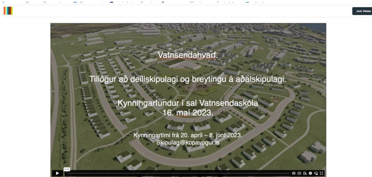
Vatnsendahvarf. Tillögur að breyttu deiliskipulagi