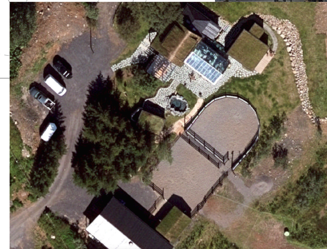
Núverandi staða - Loftmynd tekin 20/7/2022 - map.is

MHL 05 - Umsókn: Vinnustofa - listaverkstæði (fyrir myndhöggvara- og myndlistarkonu). Hluti byggingarinnar niðurgreiddur í hæðina (Skygginn)