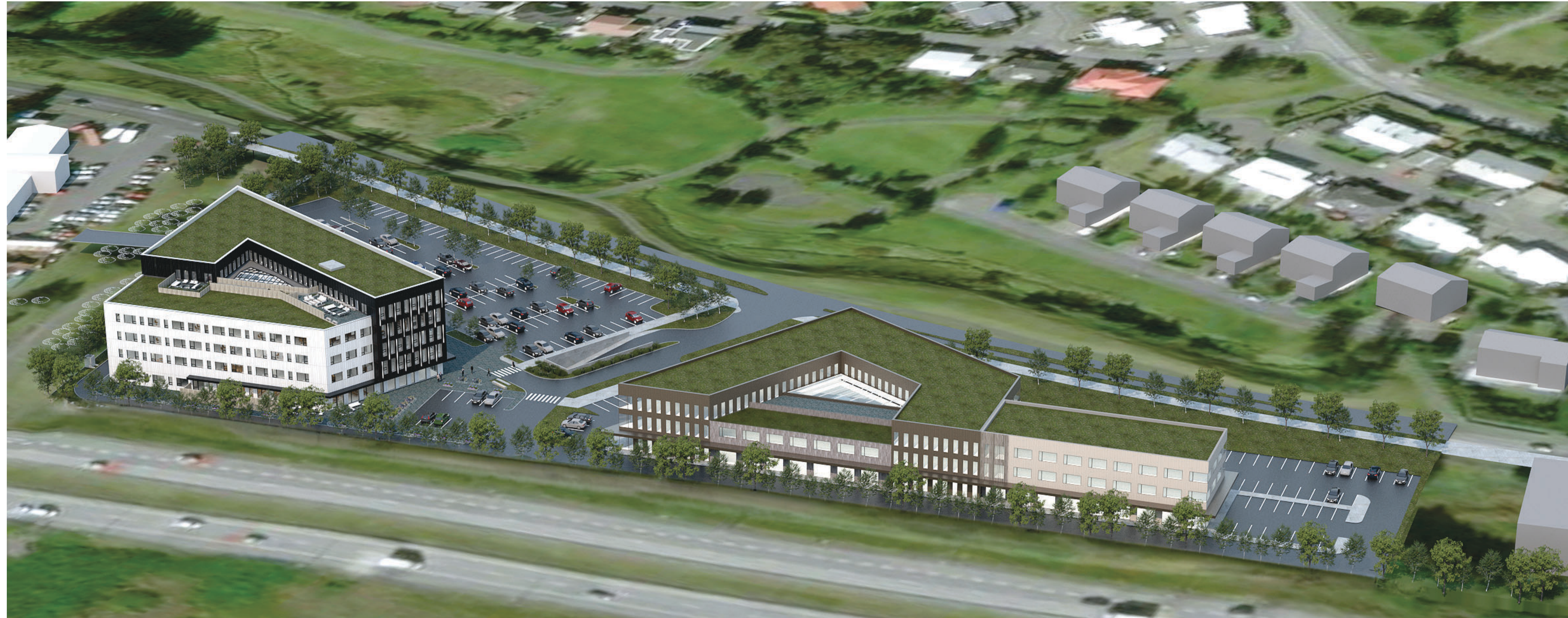
SKÝRINGARMYND - ÚTLIT EKKI BINDANDI