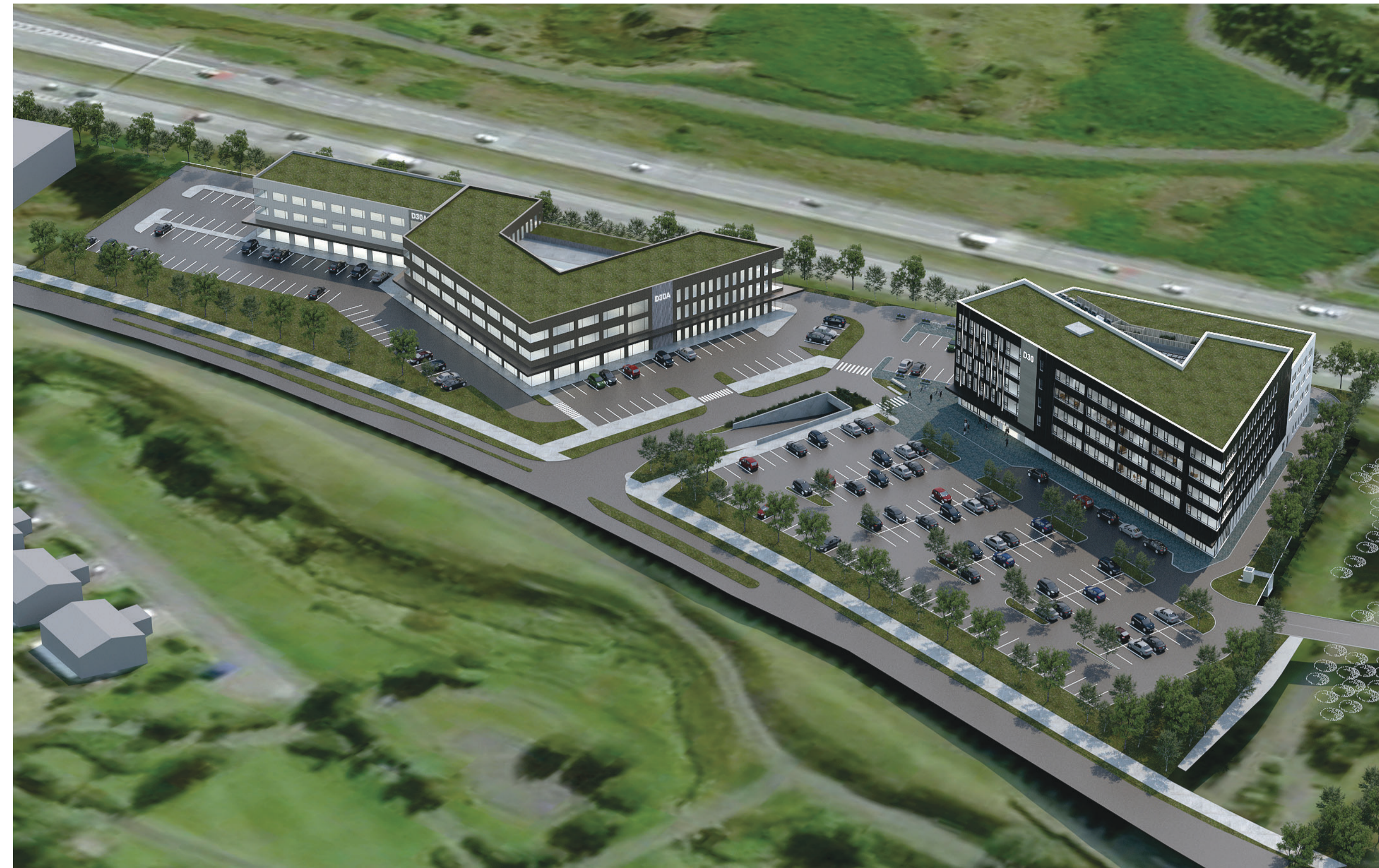
SKÝRINGARMYND - ÚTLIT EKKI BINDANDI