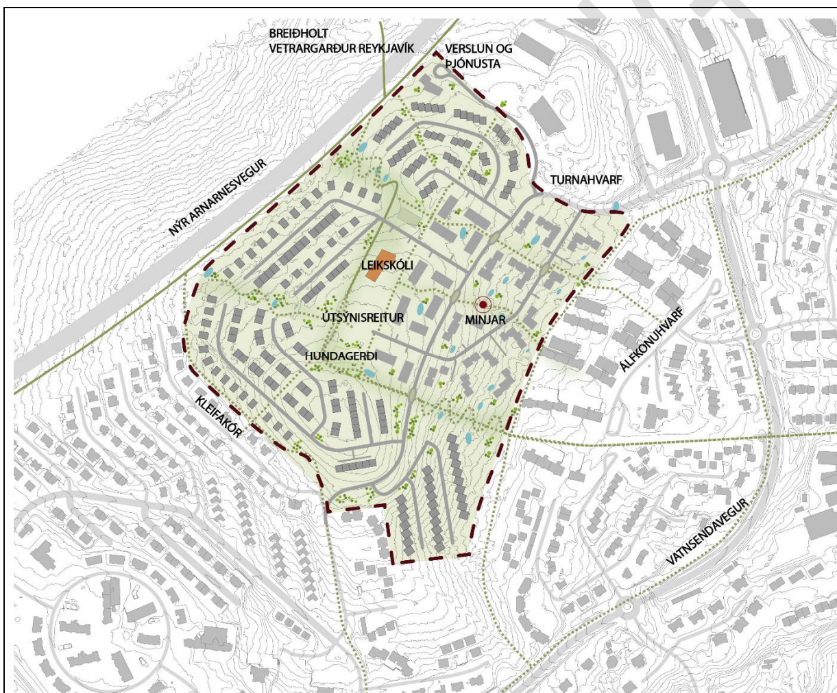
Mynd 1. Drög/tillaga að deiliskipulagi sem forkynnt var vorið 2022.

Á mynd 1 má sjá deiliskipulagsuppdráttinn eins og hann leit út þegar tillagan var forkynnt - á mynd 2 má sjá drög að deiliskipulagsuppdrætti (drög), og á eftir að móta frekar. Breytingar sem gerðar eru þar kalla á breytingu á aðalskipulagi sem er til umfjöllunar í greinargerð þessari.